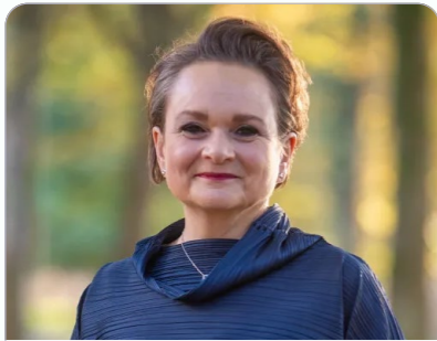
Alexandra van Huffelen

Voorzitter College van Bestuur Radboud Universiteit, Voorzitter The Economic Board