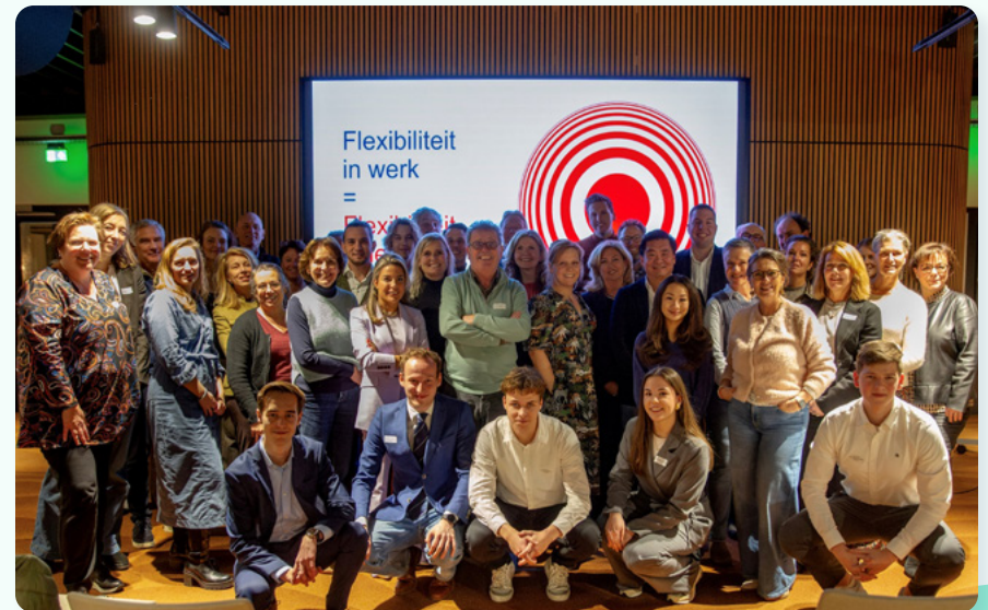
Symposium HCA 'Flexibiliteit in werk'