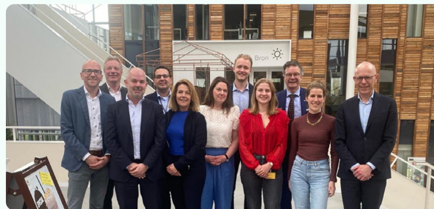
Werkbezoek ministerie OCW aan de regio Arnhem-Nijmegen