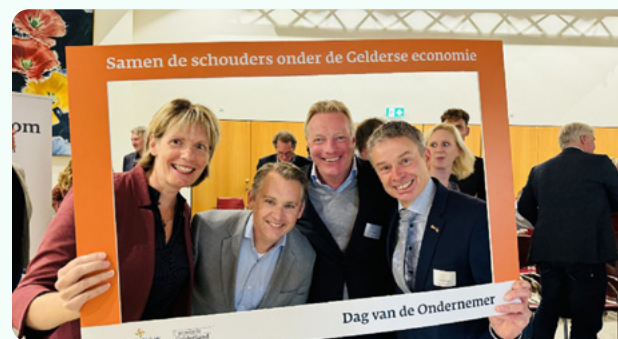
Dag van de ondernemer