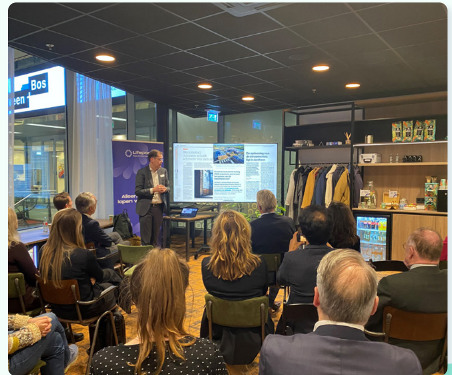
Lifeport Café Energy – Den Haag

European Hydrogen Week – Lancering van Hydrogen Valley East Netherlands en presentatie van onze Hydrogen (waterstof) position paper in het Holland Paviljoen in Brussel. Samenwerking tussen The Economic Board, Twente Board, Oost NL en Duitse partners om een grensoverschrijdende waterstofvallei te vormen.