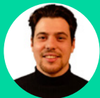
Job Sluiter IT Student Lab

"IT Student Lab werkt samen met het Human Capital Akkoord om IT-talent en regionale bedrijven te verbinden. Door deze samenwerking krijgen studenten inzicht in lokale en regionale carrièrekansen. Bedrijven kunnen vroegtijdig investeren in jong talent, wat de regio versterkt en de IT-sector toekomstbestendig maakt."